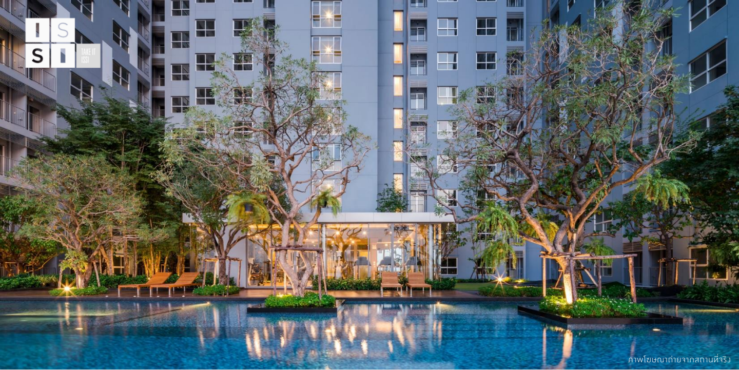
ภาพโฆษณาถ่ายจากสถานที่จริง