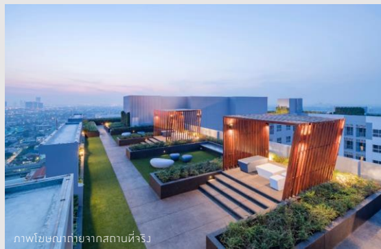
ภาพโฆษณาถ่ายจากสถานที่จริง

ติดต่อโทร : 086-892 1672 www.charnissara.com